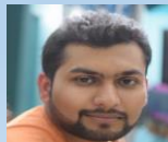
Малой Трпатки Менеджер проекта Blockchain