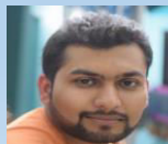
Малой Трпатхи Менеджер проекта Blockchain